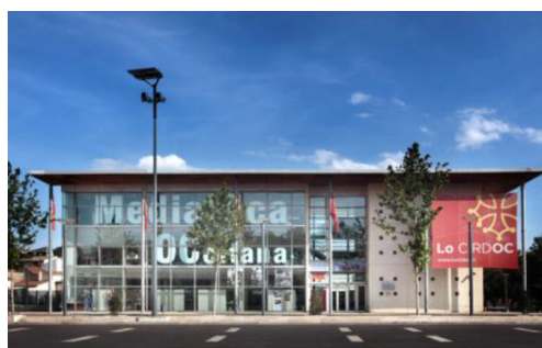
Centre interrégional de développement de l'occitan

Le CIRDOC s'appuie dès 2009 sur le prestataire de service Arkhenum , pour pouvoir numériser ses fonds propres mais aussi ceux des établissements partenaires.